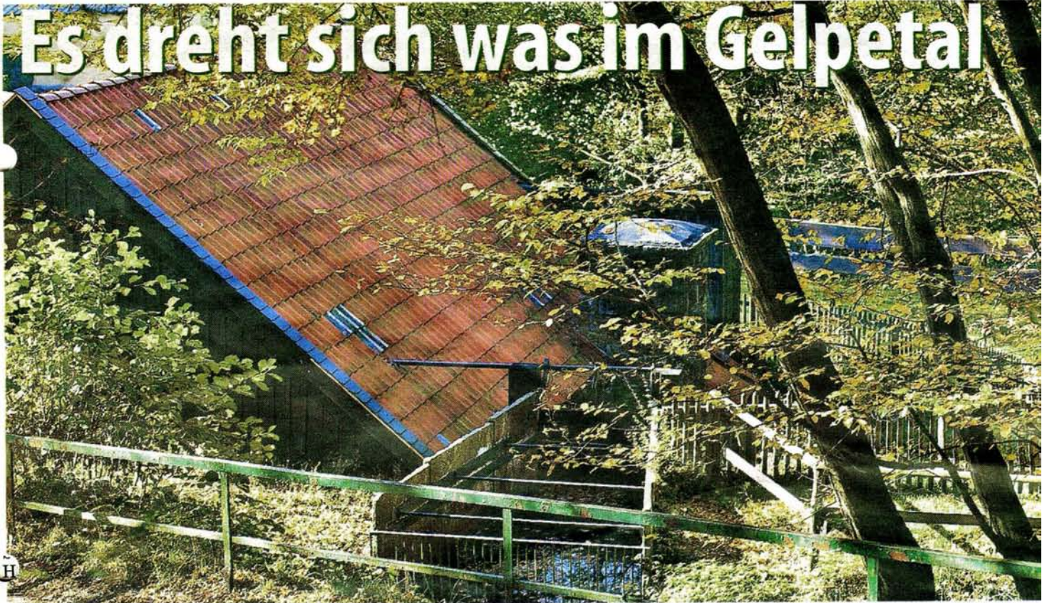
Malerisch gelegen ist der Steffenshammer im schönen Gelpetal